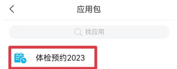
图2：45岁以下教职工显示界面