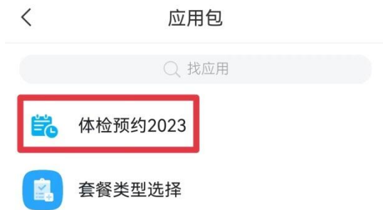
图1：45岁及以上教职工显示界面